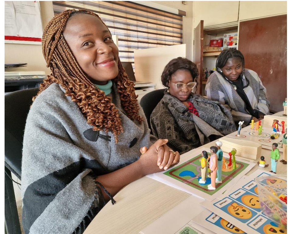
Bijscholing - Poptalk training voor counseling van getraumatiseerde kinderen

We beschikken over drie goed opgeleide psychologen/trainers die niet alleen ons eigen team trainen, maar zelf ook jaarlijks deelnemen aan nieuwe externe trainingen via internet. Ons team bestaat uit een programma coördinator/-speltherapeut, twee psychologen/trainers/speltherapeuten, zes trauma counselors en een trauma trainer. Verscheidene van onze stafleden zijn betrokken bij de ontwikkeling van nieuwe trainingen en trauma programma's, in nauwe samenwerking met Claudy Regterschot vanuit Nederland.