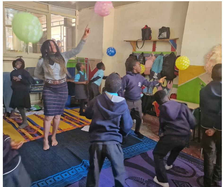
Trauma programma voor schoolkinderen

In de praktijk merken wij dat leerkrachten zelf meer onderwijs nodig hebben in het omgaan met getraumatiseerde kinderen. Daarnaast hebben zij zelf ook te maken (gehad) met traumatische gebeurtenissen in hun leven. Gezien de enorme achterstand in Nigeria op het gebied van geestelijke gezondheid, is het van groot belang dat leerkrachten en hulpverleners ook de kans krijgen om van hun trauma's te herstellen. Om deze reden heeft KicF het projectplan 'Trauma-sensitieve scholen in Nigeria' opgesteld. In dit verslag beschrijven we de stappen die onze stichting hierin heeft ondernomen.