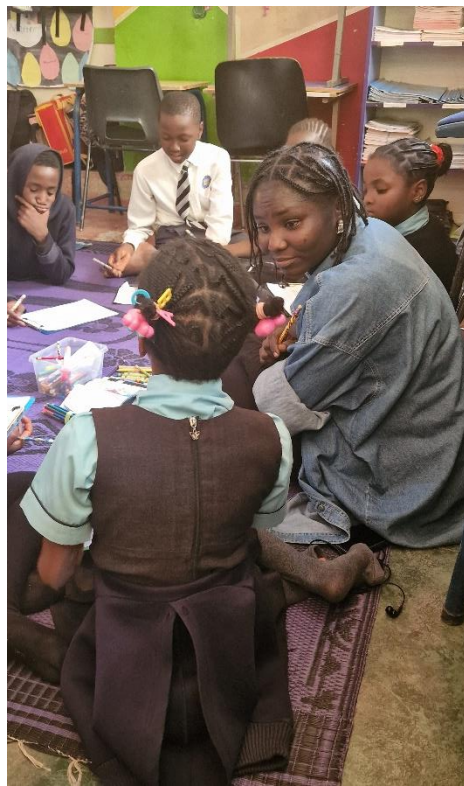
Kinderen in Nigeria zijn het gewend om activiteiten op de grond te doen

In de praktijk merken wij dat leerkrachten zelf meer onderwijs nodig hebben in het omgaan met getraumatiseerde kinderen. Daarnaast hebben zij zelf ook te maken (gehad) met traumatische gebeurtenissen in hun leven. Gezien de enorme achterstand in Nigeria op het gebied van geestelijke gezondheid, is het van groot belang dat leerkrachten en hulpverleners ook de kans krijgen om van hun trauma's te herstellen. Om deze reden heeft KicF het projectplan 'Trauma-sensitieve scholen in Nigeria' opgesteld. In dit verslag beschrijven we de stappen die onze stichting hierin heeft ondernomen.