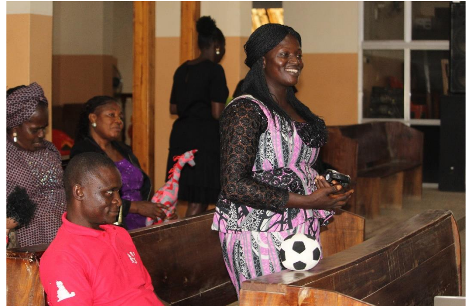
Veel docenten zijn leergierig en geven aan door de trauma trainingen van KicF totaal veranderd zijn in de omgang met de kinderen in hun klassen!

Hierdoor ontstaat er een veilige en plezierige leer-, leef- en werkomgeving voor zowel de kinderen als de leerkrachten/hulpverleners. Voor de scholen in Nederland klinkt bovenstaande mogelijk heel gewoon. In Nigeria is er sprake van een enorm grote achterstand in de ontwikkeling van leerkrachten en hulpverleners. Om een trauma sensitieve school te zijn of te worden moet men in Nigeria de kijk op leren en gedrag veranderen. In plaats van over kinderen te denken 'wat is er mis met jou' moet je denken: wat is er gebeurd waardoor jij zo reageert? Leerkrachten in een trauma sensitieve school hoeven geen therapeuten te worden maar wel meer ondersteuners op andere