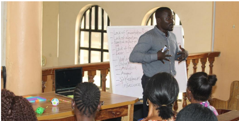
Trauma training voor docenten, stap één is het verwerken van je eigen trauma, voordat je kunt gaan kijken naar de trauma's van de kinderen in je klas.

Wij hebben hier geleerd dat er een nog grotere impact bereikt kan worden dat niet alleen enkele functionarissen in een school of bijvoorbeeld kindertehuis worden opgeleid, maar alle medewerkers de trauma sensitieve aanpak implementeren in hun onderwijs en omgang met de kinderen. Dit is ook van toepassing op de gehele staf van de school.