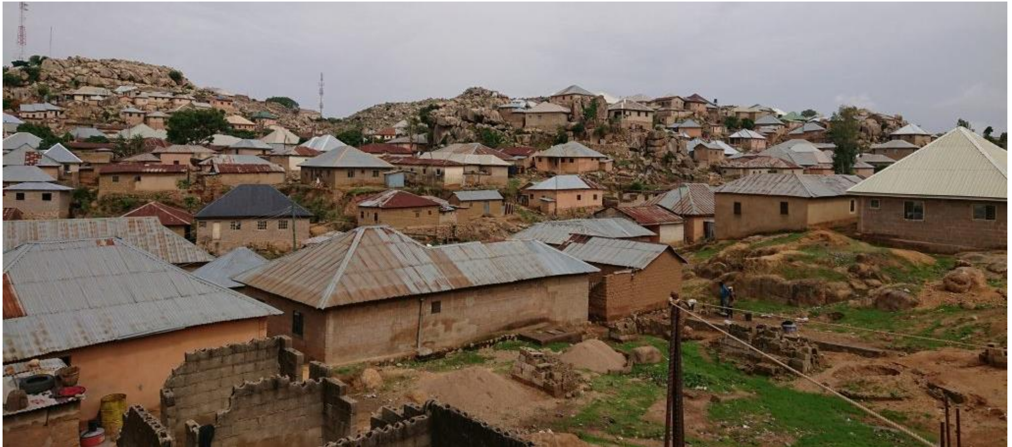
Sloppenwijk Jenta in Jos, de stad waar het kantoor van KicF is gehuisvest

In september 2022 is de KicF gestart met het nieuwe meisjesproject wederom in sloppenwijk 'Jenta' in de stad Jos (25 meisjes) en een groep van 25 meisjes op een grote school eveneens in de stad Jos.