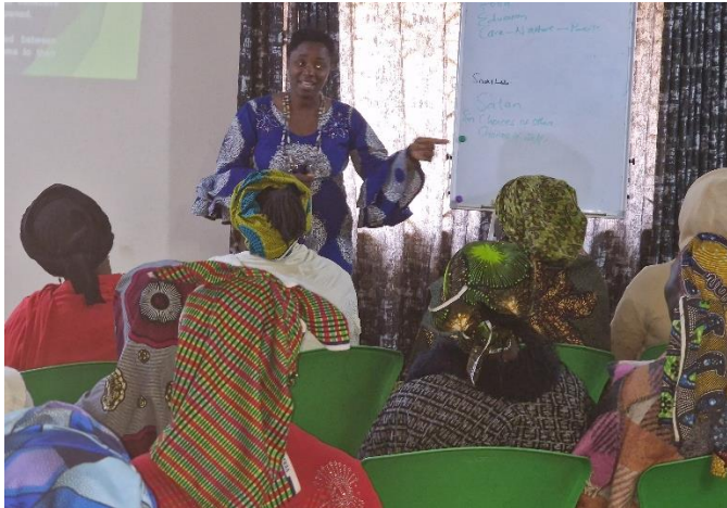
Training binnen het kantoor Kicf

In 2023 hebben onze medewerkers opnieuw deelgenomen aan diverse trainingen en workshops ter bevordering van hun deskundigheid.