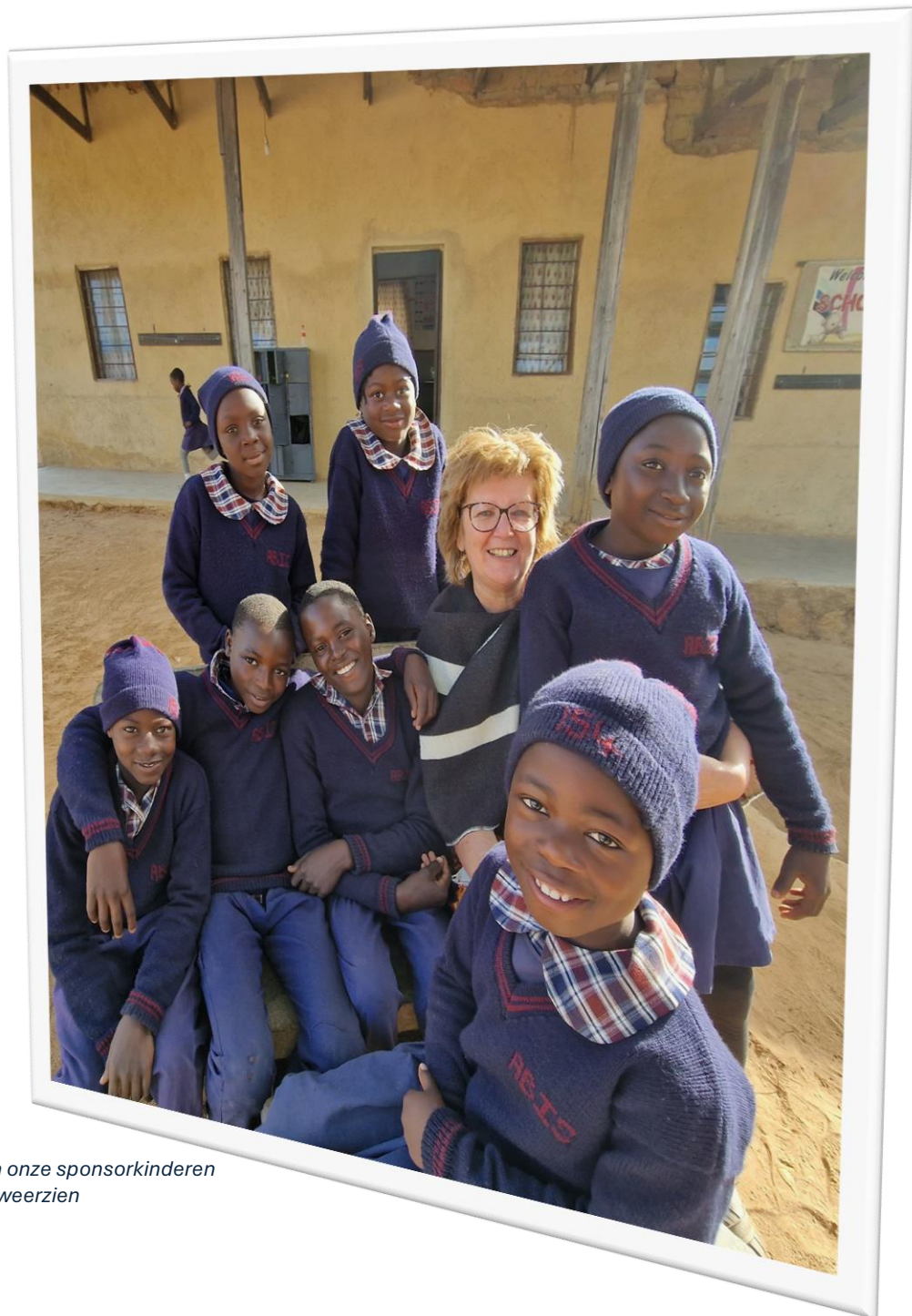
Jaarlijks bezoek aan onze sponsorkinderen altijd een feestelijk weerzien