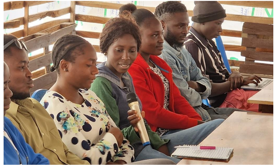
Een groep jonge leiders in de sloppenwijk Jenta. Zij leren hoe ze kunnen omgaan met getraumatiseerde kinderen. Levens worden veranderd door de KicF trainingen

Als particulier mag u uw gift opvoeren als aftrekpost op uw inkomen. Als onderneming versterkt u uw bedrijfsimago door maatschappelijke betrokkenheid te tonen, wat positieve publiciteit genereert en klanten aantrekt die waarde hechten aan sociale verantwoordelijkheid. Als u wilt kunnen we uw organisatie noemen als sponsor van de stichting, wat uw naamsbekendheid vergroot.