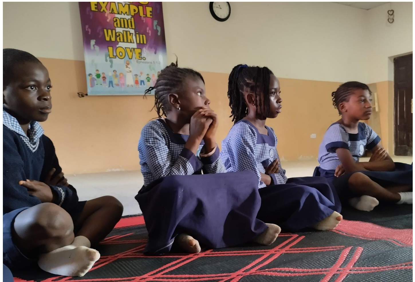
Trauma counseling voor schoolkinderen