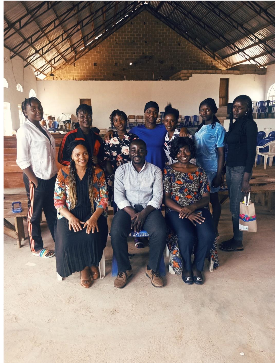
Counseling van tienermeisjes door de psychologen en trauma counselors van KicF

Voor de tweede uitvoeringsfase van het meisjesproject (start in september 2021) hebben we gekozen voor 50 meisjes uit een sloppenwijk genaamd "Jenta" in de stad Jos. De KicF had de sterke wens om het project in een andere omgeving dan een kindertehuis uit