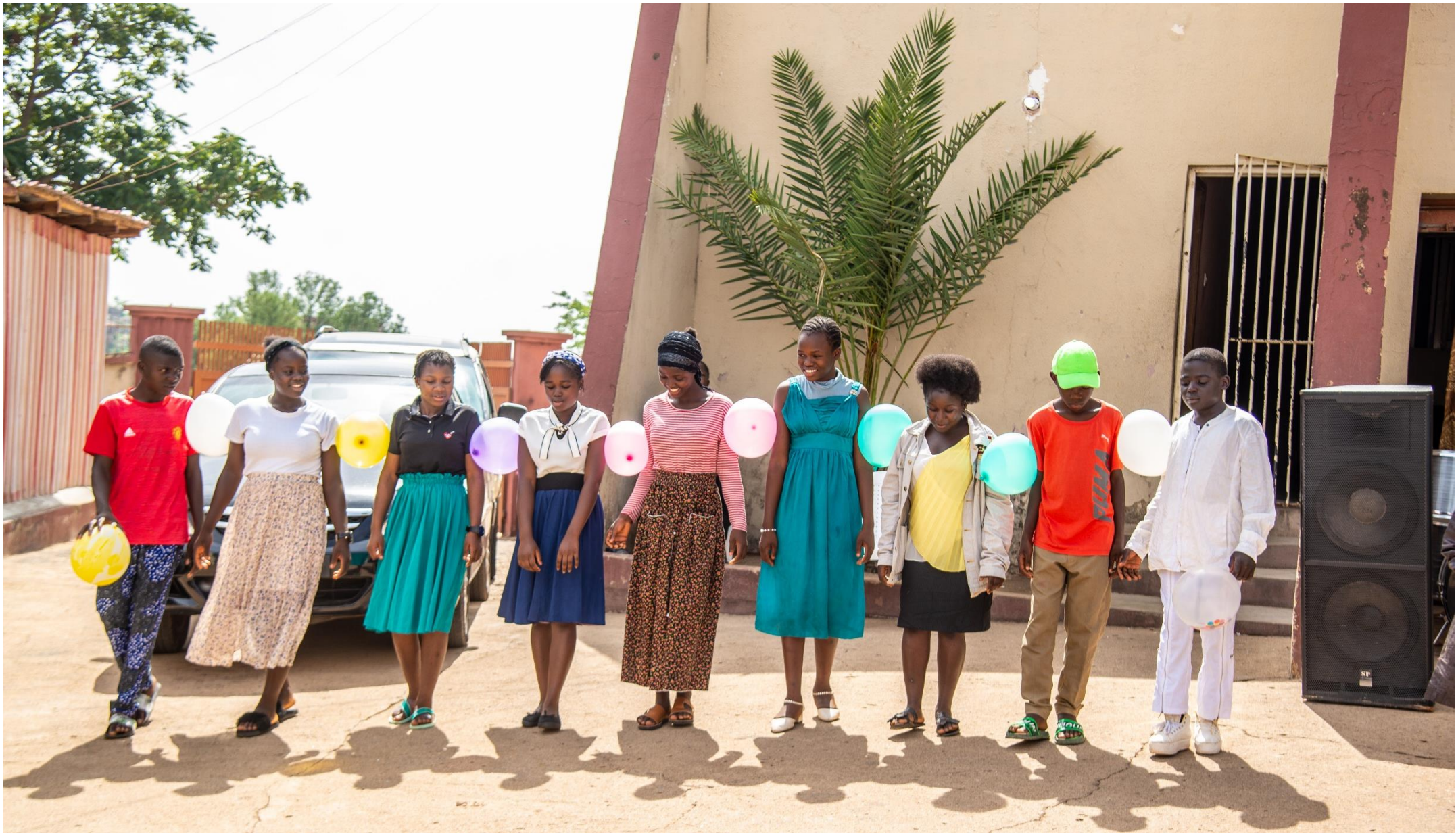
Speltherapie is een belangrijk onderdeel van onze trauma programma's