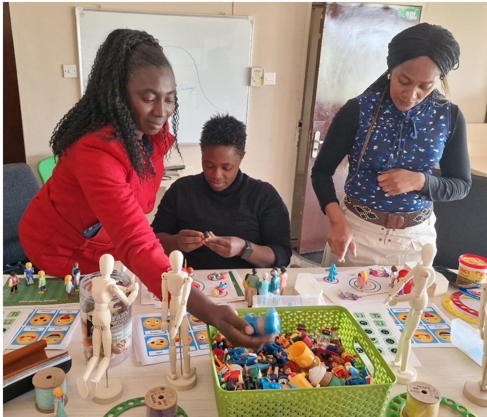
Bijscholing KicF staf

In oktober 2023 heeft het team een introductie workshop gevolgd van POPtalk. POPtalk is een methode waarmee je aspecten van iemands belevingswereld letterlijk in beeld brengt. Met poppetjes en symbolisch materiaal kan iedere situatie of elk probleem worden opgesteld. Deze nieuwe methode is ontwikkeld door Trudy Borst uit Nederland en is speciaal voor de KicF vertaald in het Engels. De staf van de KicF gaat in 2024 getraind worden in het toepassen van de POPtalk methode in de hulpverlening van getraumatiseerde kinderen.