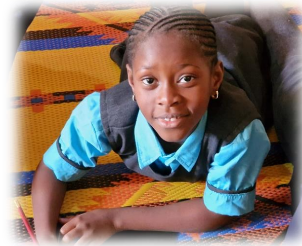
Door traumahulp aan kinderen komt er weer een lach op hun gezicht

De stafwerkers van het team in Nigeria ontvangen een salaris conform de Nigeriaanse standaard voor leerkrachten en hulpverleners.